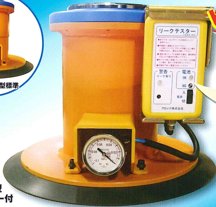
S300-350型 リークテスター付